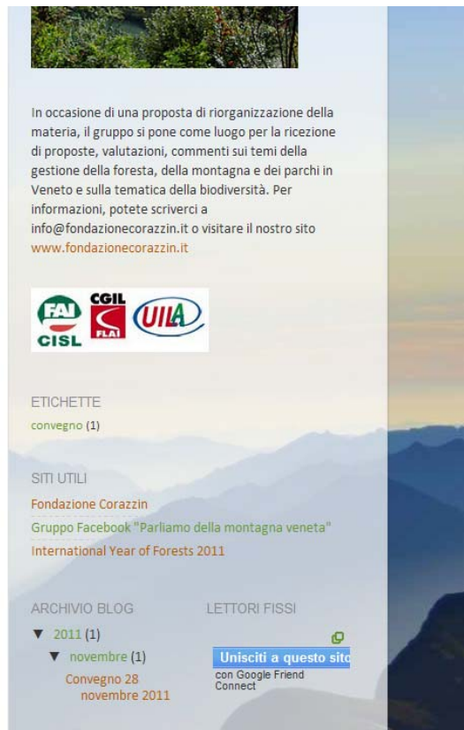
Figura 2: inserire un commento